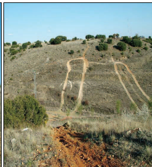
Imágenes tomadas en nuestro municipio que evidencian la degradación del paisaje por la circulación de vehículos no autorizados